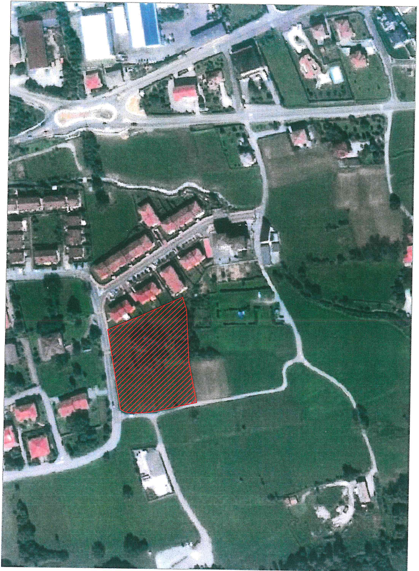
ORTOFOTO CON LOCALIZZAZIONE AMBITO